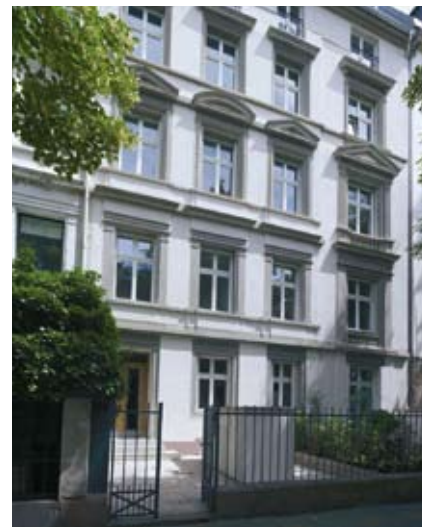
► Das 1900 erbaute, fünfstöckige Gebäude im Frankfurter Westend wurde komplett umgebaut. Dabei entstanden drei Maisonettewohnungen, die sich über zwei Etagen erstrecken.

Das klare und filigrane Design der Edelstahl-Küchenelemente gliedert sich lebhaft im Raum ein und bildet das Zentrum der Wohnung, wo man gerne verweilt.