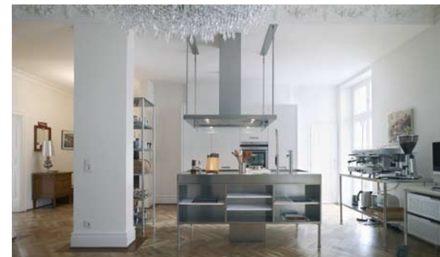
▲ Der alte Wohnungsgrundriss wurde geöffnet, um Raum für eine Treppe zum Obergeschoss zu schaffen. Die so entstandene Freifläche ist zentraler Knotenpunkt und wie geschaffen zum gemeinsamen Kochen.